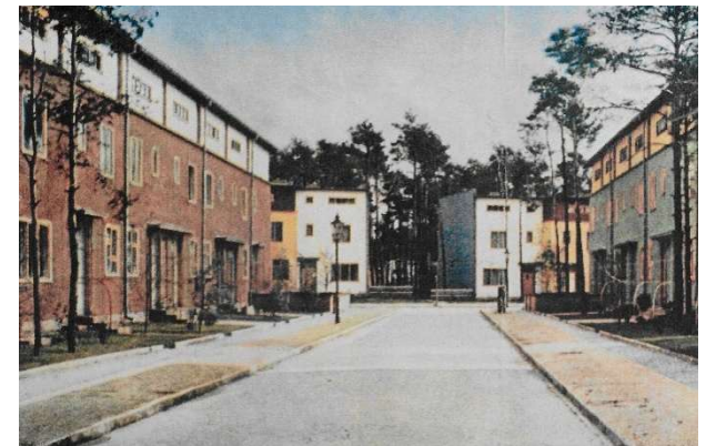
Historische Aufnahme, vermutlich um 1930.